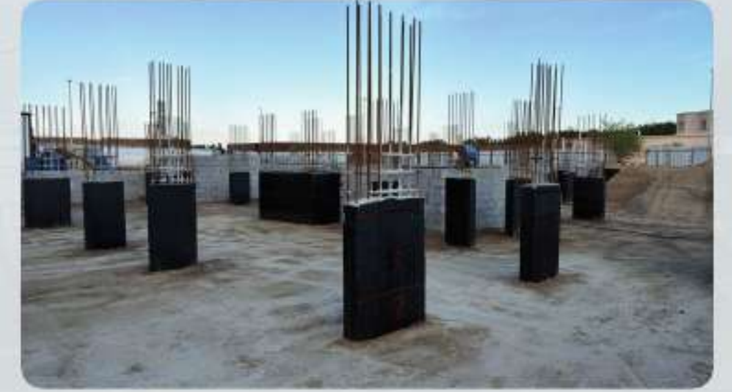
الدفان على طبقات