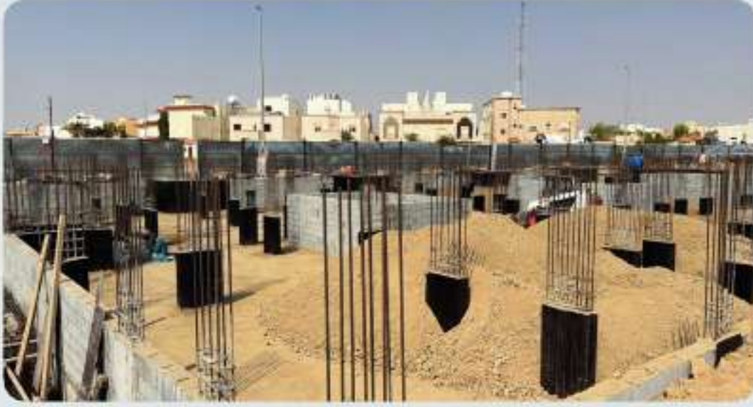
التربة المستخدمة من نوع صبير