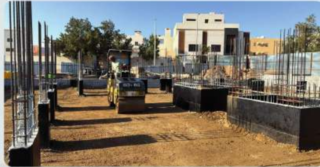
الدك على طبقات