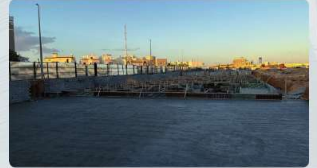
صبه نظافه كامل الأرض