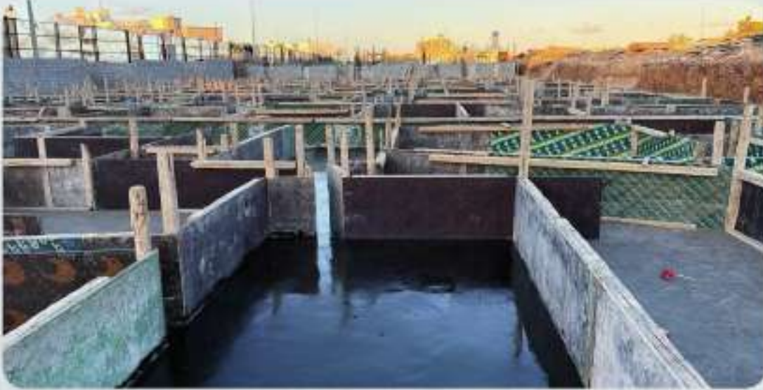
عزل القواعد من الأسفل